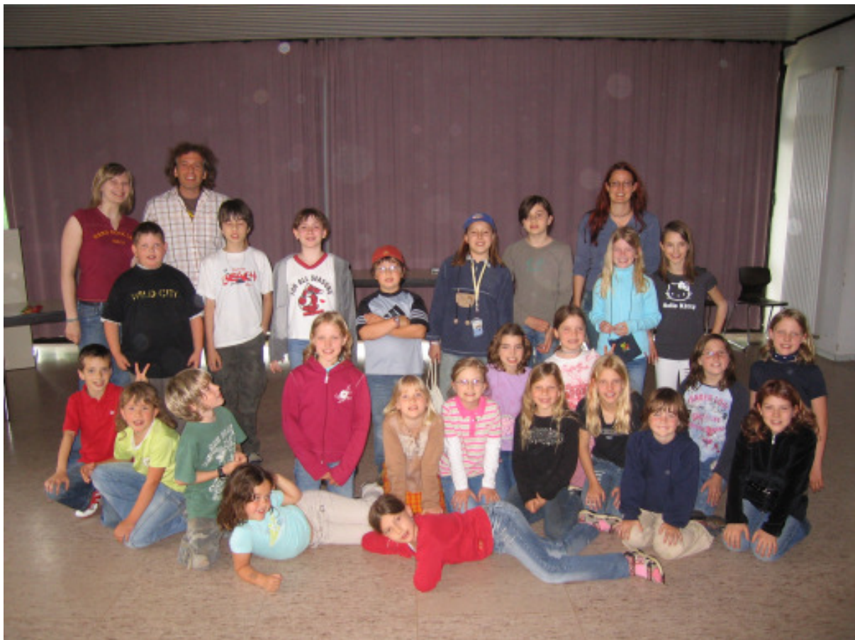
(Unsere Jugendgruppe beim Workshop in Oberthal)

Ziel dieses Lehrganges war es, die Kinder spielerisch auf Theaterspielen vorzubereiten. Am Ende des Workshops wurde das Erlernete vor Eltern, Geschwistern, Freunden und Verwandten aufgeführt. Unsere Nachwuchsspieler hatten dabei sichtlich Freude und haben ihre „Sache“ sehr gut gemacht. Für Heimweh war da kein Platz.